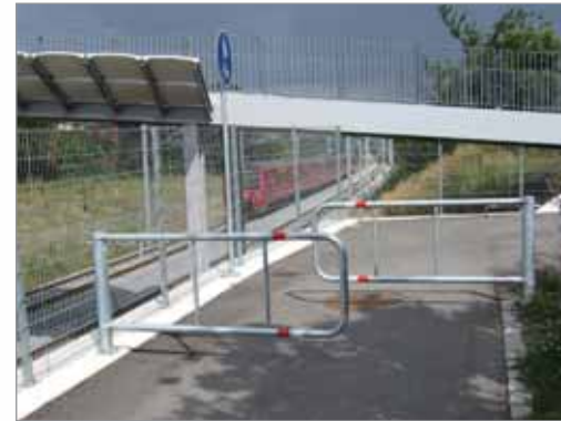
BGHX her benyttet på en brandvej som effektiv spærre for gående på vej til S-toget