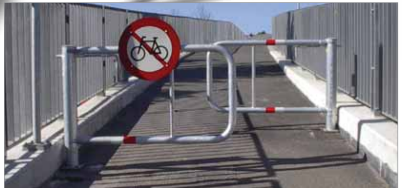
BGHX virker fardtæmpende på cykler og knallerter

Leveres med nedstøbningsfundament og refleksset. Kan bestilles med baggrundsmærkning og beslag for mur.