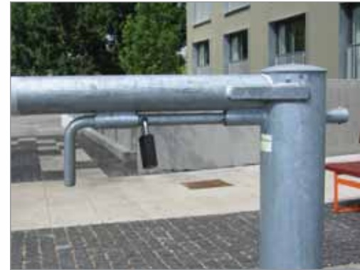
BGHX med hængelås. Ved akutte situationer kan redningsmandskab åbne med boltsaks

Rød/hvid baggrundsafmærkning kan bestilles.