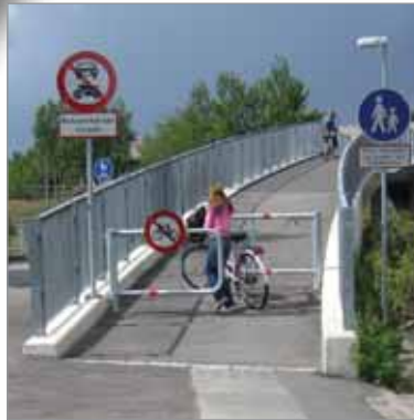
Med BGHX må cyklister stå af og trække cyklerne på gangstien over broen