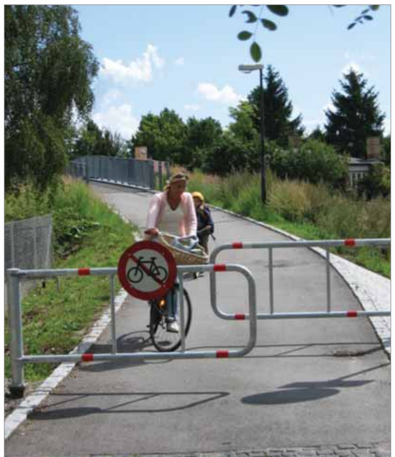
BGHX beskytter ved udkørsel når et sæt er opstillet forskudt