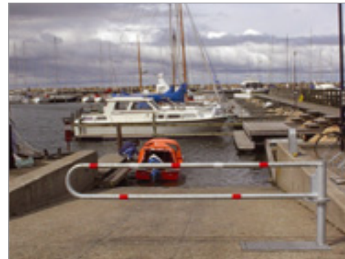
BIX cylinderlås med holdenøgle ved slæbested til søsætning af trailerbåde