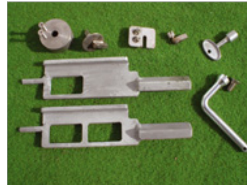
Klink 1 -2 lås, vridspole, trekant- og cylinderlås, trehulsskrue og -nøgle samt trekantnøgle

Hele fundamentet med skruehoveder skal trykkes ned i betonen.