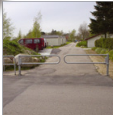
BIX opstillet med SR rækværk