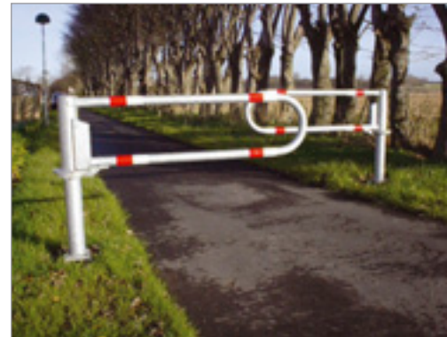
Cykelsti med 2 BIX 2,0 m opstillet forskudt ved overlap på 500 mm, så der opstår en sluse

Leveres med nedstøbningsfundament, refleksset og trekantnøgle. Kan bestilles med baggrundsafmærkning og beslag for mur.