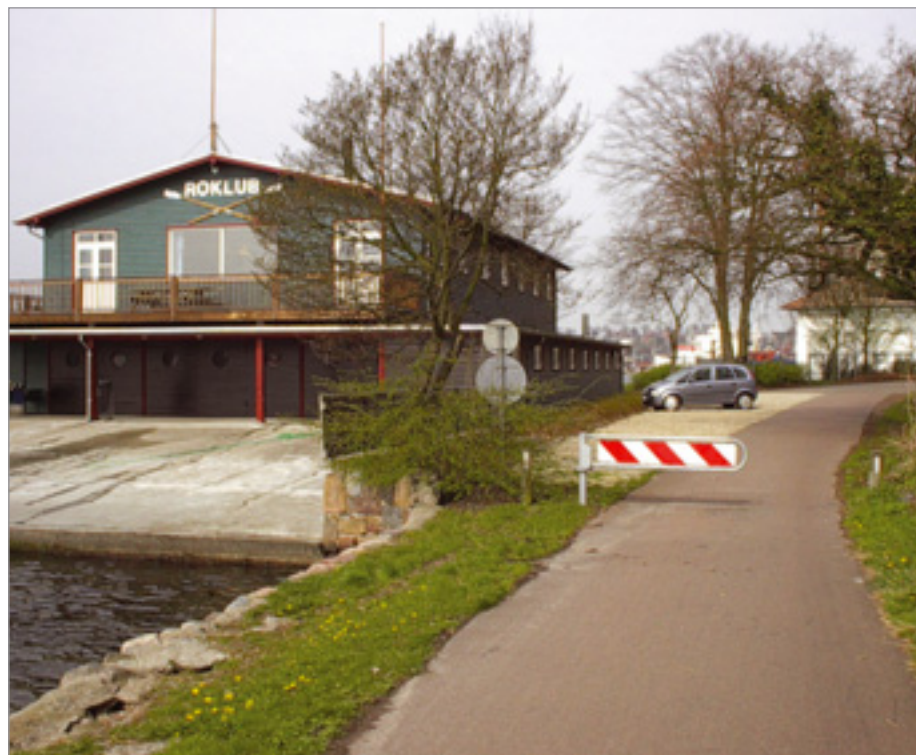
BIX med baggrunds mærkning ved natursti ud til Svendborgsund