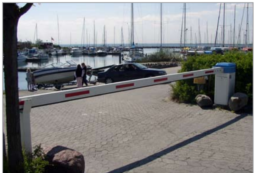
Adgangsregulering til Brøndby havn