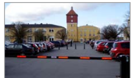
Fjern- og tastaturstyret bomanlæg i Århus