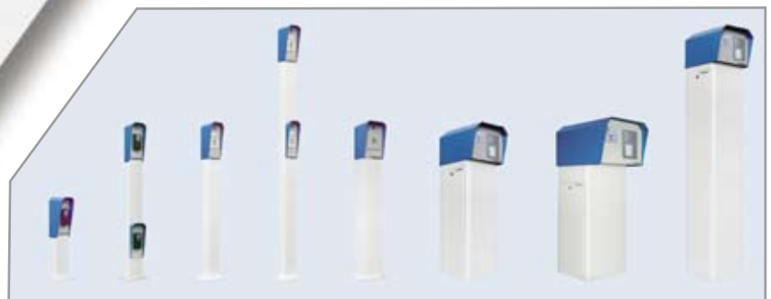
Søjler og standhuse passende til ethvert anlæg

Kan leveres i alle standard RAL farver, og kan derfor passes ind i ethvert miljø.