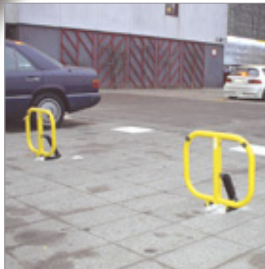
VallaStop er en effektiv P-vogter

Leveres med cylinderlås. Ønskes den ændret til Ruko-cylindersystem, kontakt da lokal låsesmed.