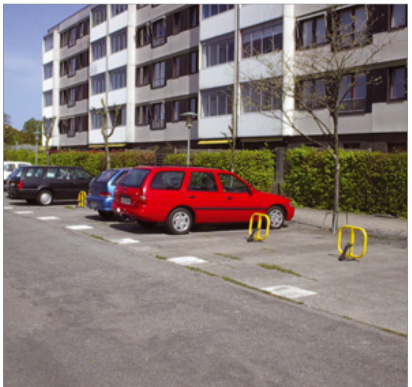
VallaStop her vist opstillet på alle parkeringspladser i et boligområde