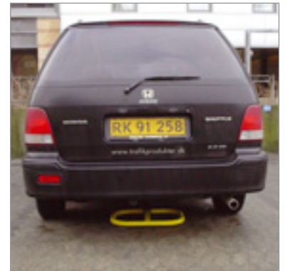
VallaStop i nedfældet position