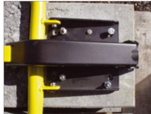
VallaStop passer til betonfod med indstøbte skruebøsninger

Leveres på bestilling mod tillæg med to låse.