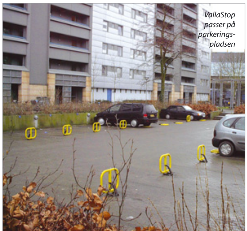
VallaStop passer på parkeringspladsen