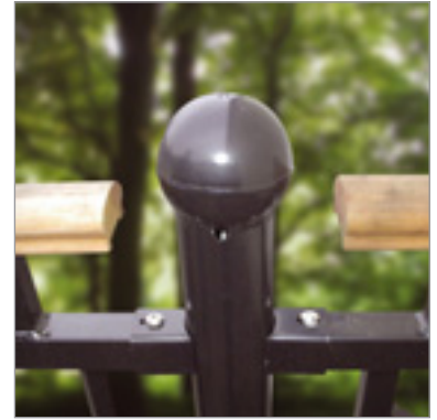
PYNT rækværk med detaljer af stolpe, beslag og håndliste