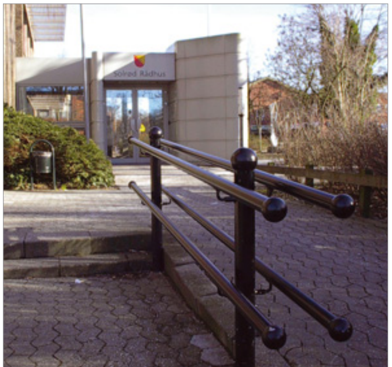
Det dekorative FLEX rækværk matcher også et rådhus