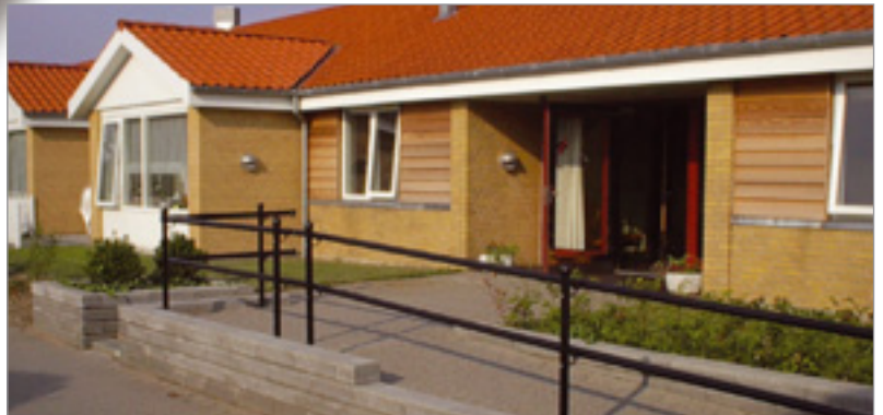
FLEX med bevægelige stolpebeslag sikrer opstilling i både stigende og plant terræn