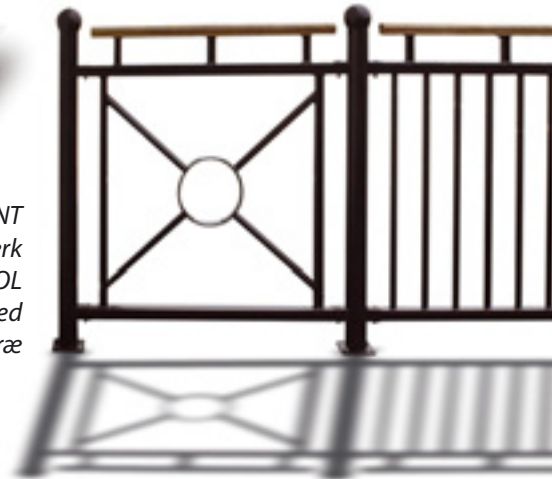
PYNT rækværk model SOL til venstre med håndliste i træ

Hurtig og enkel montering for både FLEX og PYNT.