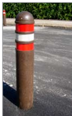
Universal med tre reflekser